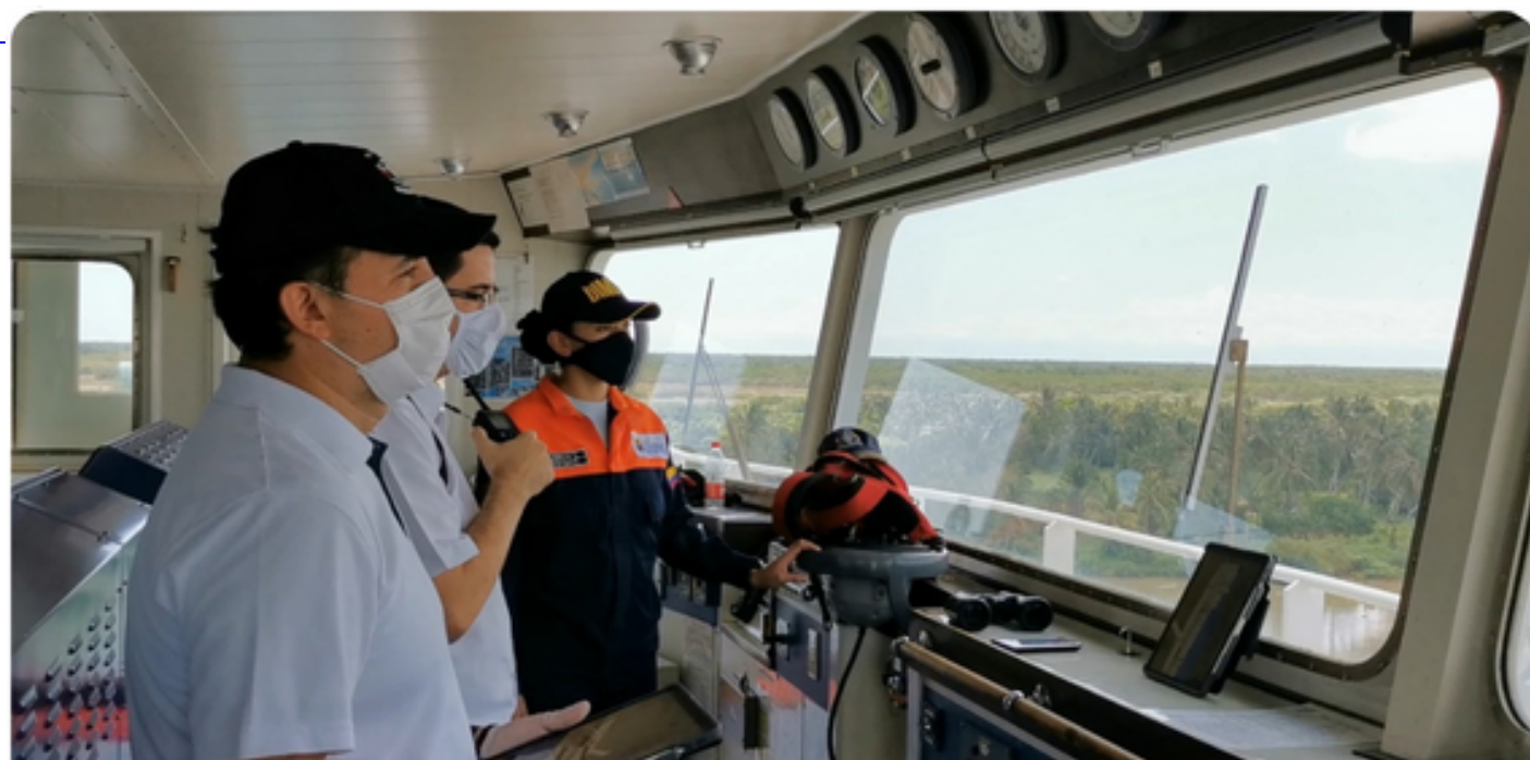
Sistema Comando de Incidentes