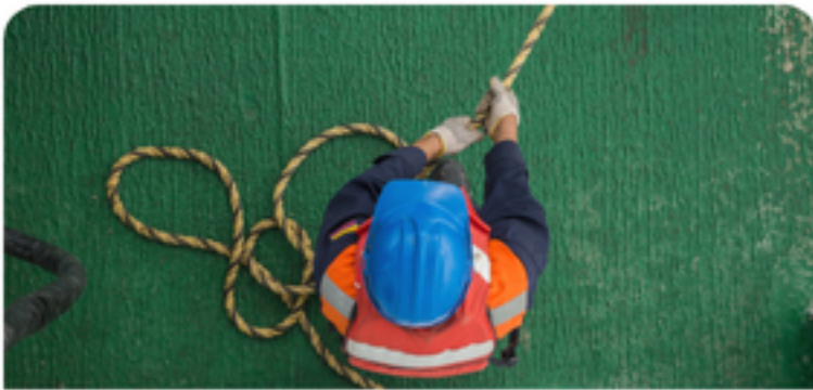
Simulacros y ejercicios