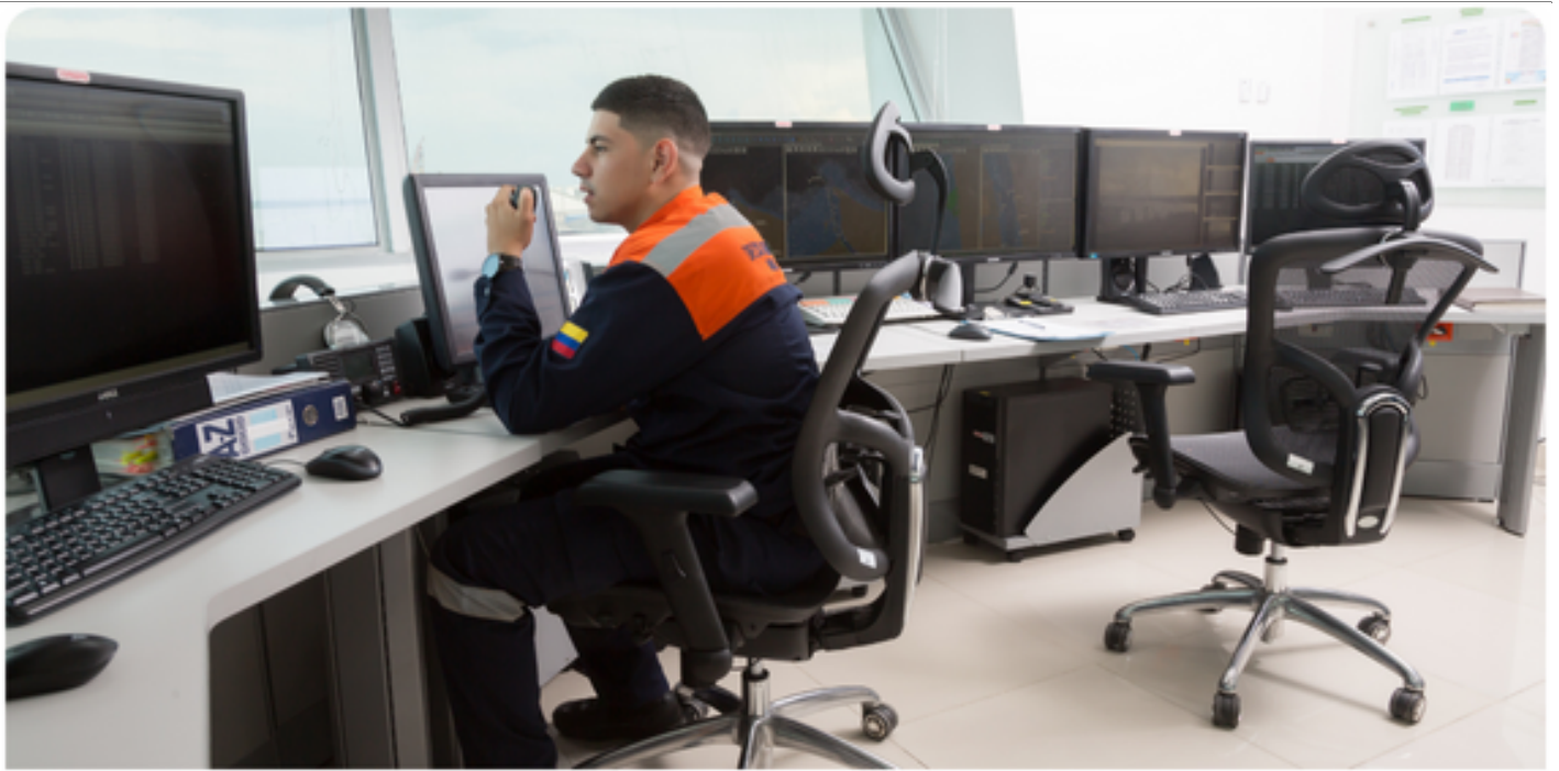
Incidentes en actividades marítimas