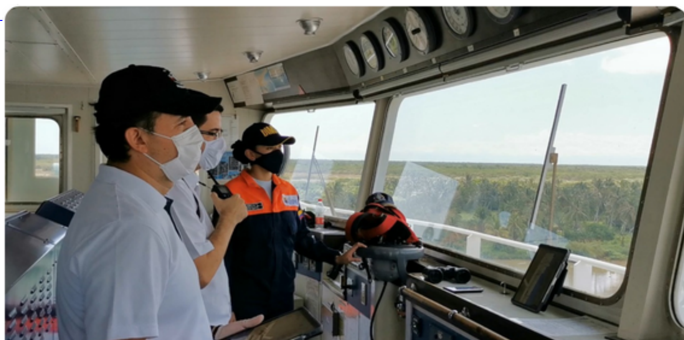
Sistema Comando de Incidentes