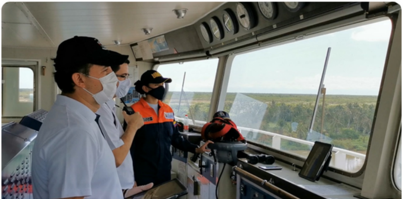
Sistema Comando de Incidentes