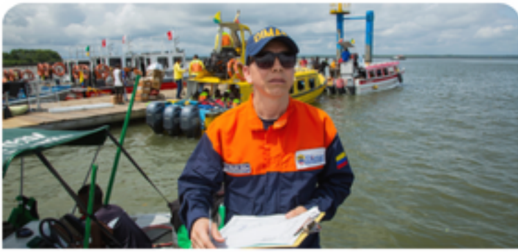
Evaluación de Riesgos