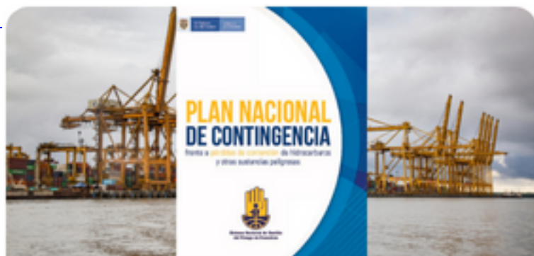
Plan Nacional de Contingencias

Es la respuesta rápida a sucesos de contaminación presentados en los mares por derrames de hidrocarburos u otras sustancias nocivas, de manera que se minimice el impacto ocasionado por aquella actuación.