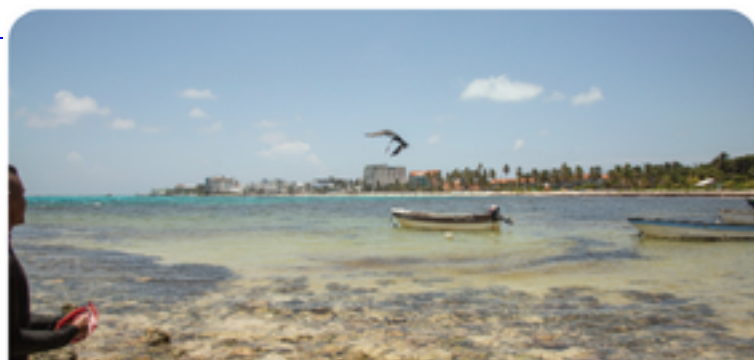
Mapas de Sensibilidad Ambiental