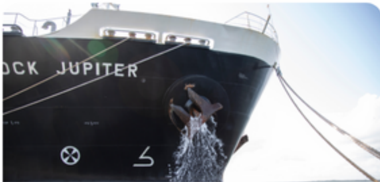
Agua de lastre

A continuación se presentan cuatro vectores principales mediante los cuales es posible que se genere contaminación biológica en el mar: