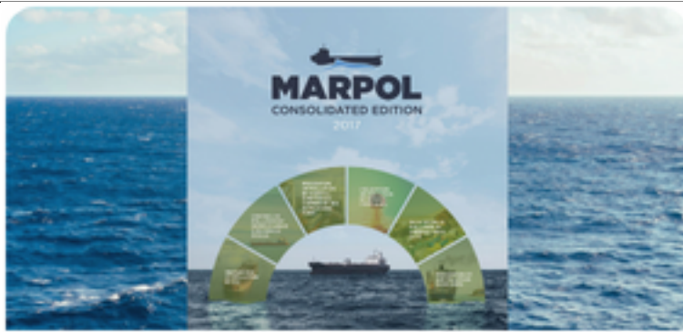
Control de descargas por buques