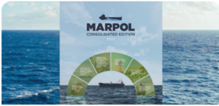
Control de descargas por buques