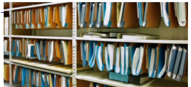
Normatividad Protección del Medio Marino