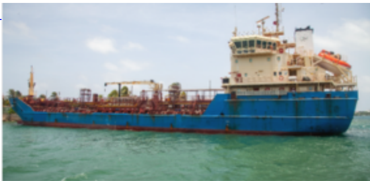
Prevención de la contaminación marina