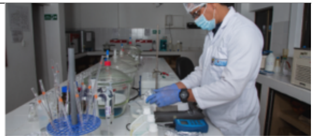
Componente Científico para la Protección del Medio Marino