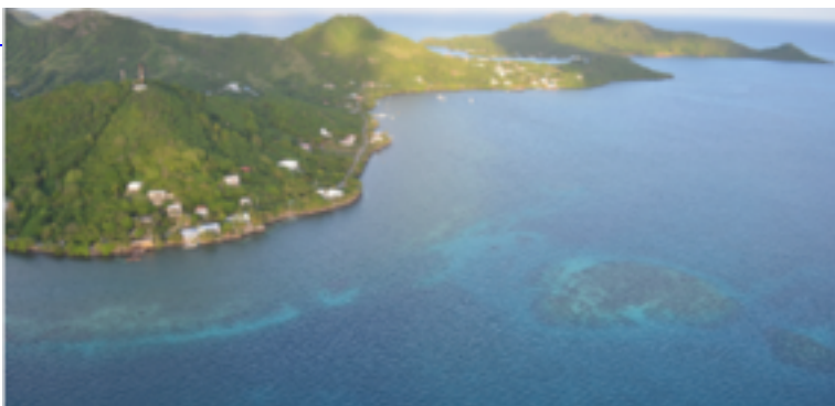
Zonas de Protección Especial