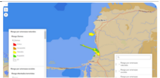
Mapas de Riesgos