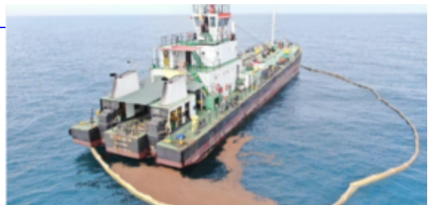
Preparación y Respuesta (PNC)