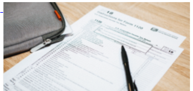
Documentos y Enlaces de Interés