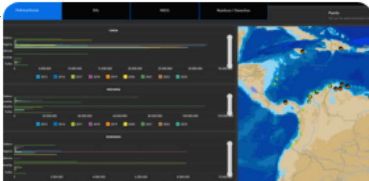
Categoría de Sustancias