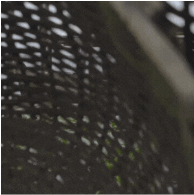
Transporte Fluvial Internacional