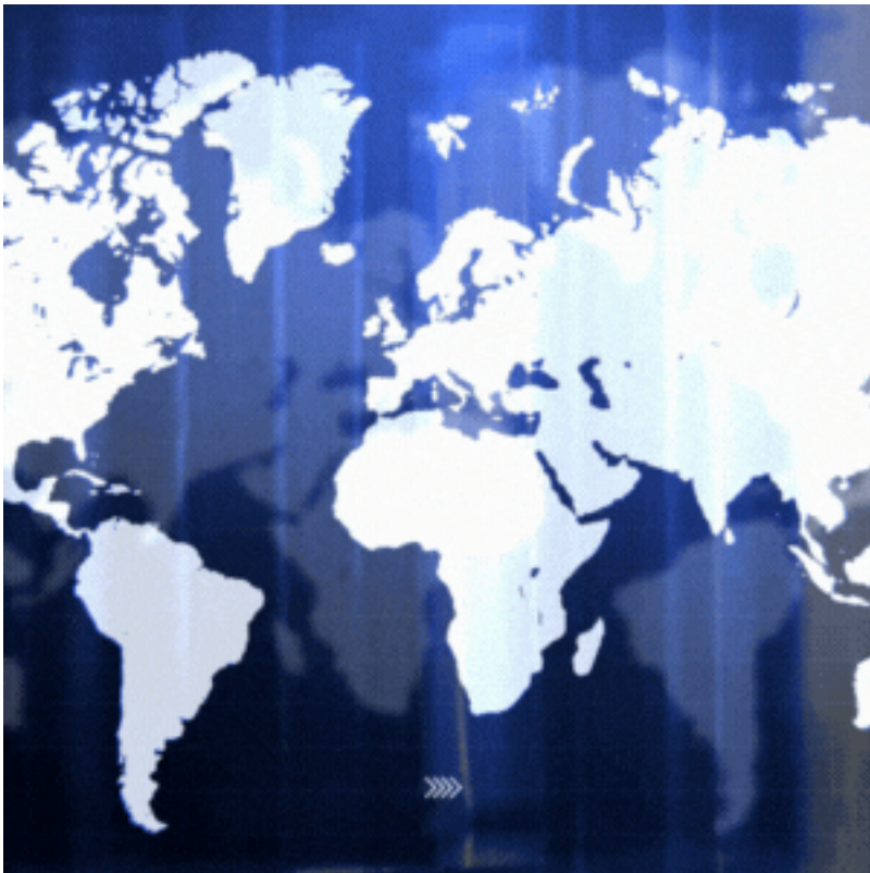
Transporte Marítimo en Escenarios Internacionales