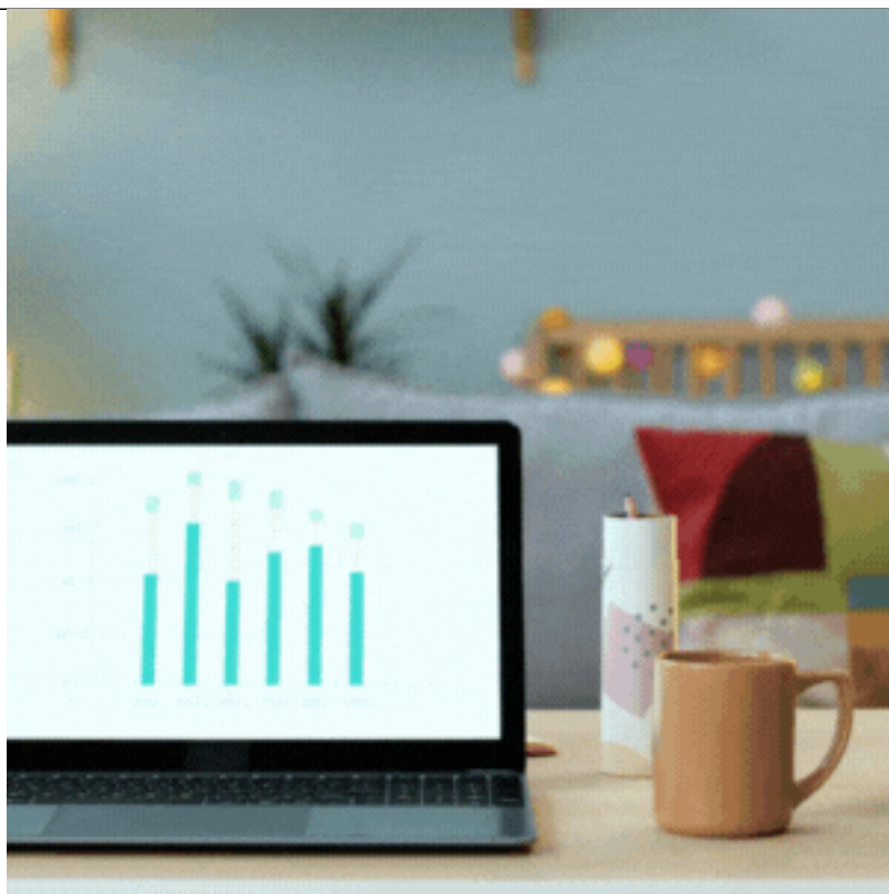
Informes e infografías