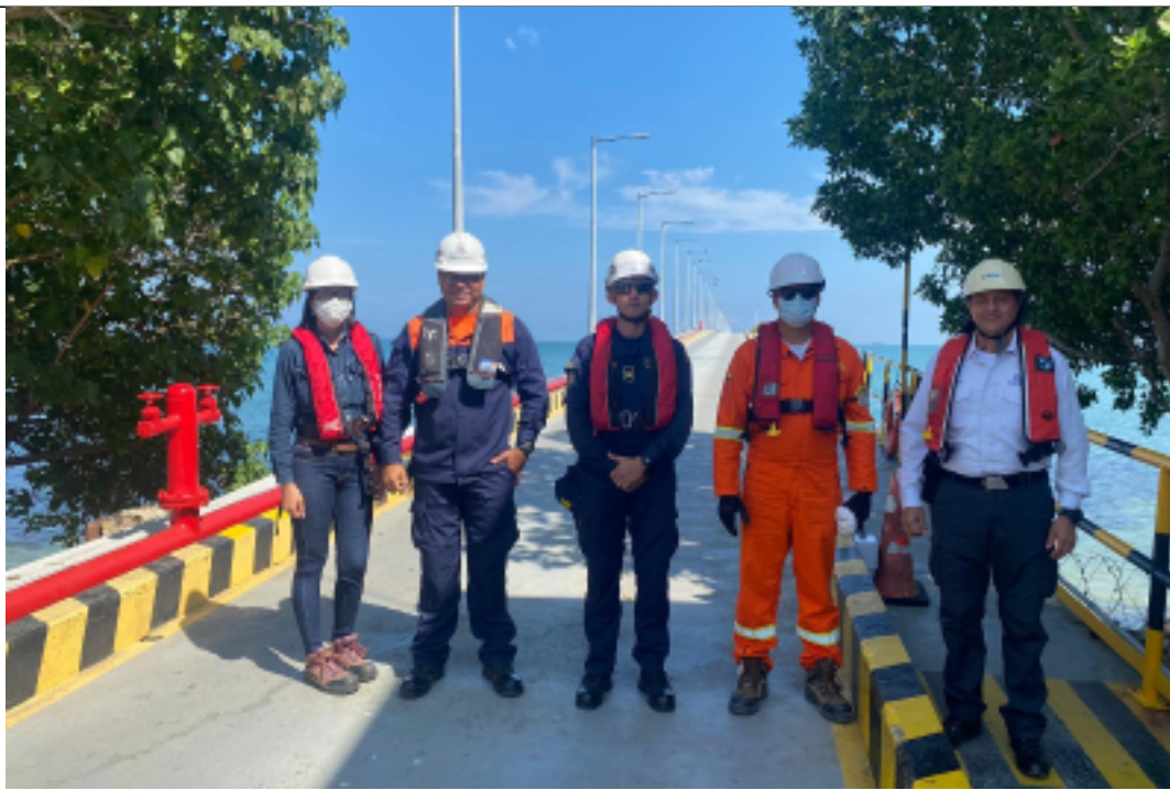
Visitas de seguridad marítima