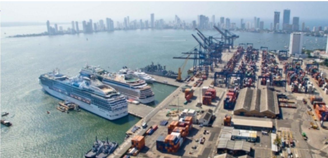
Sociedad Portuaria Regional Cartagena