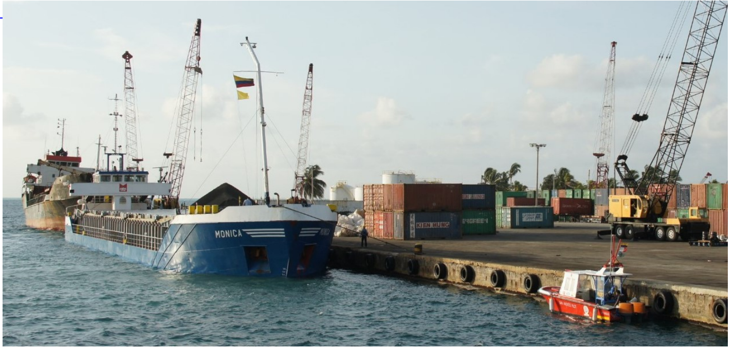
Sociedad Portuaria San Andrés Port Society