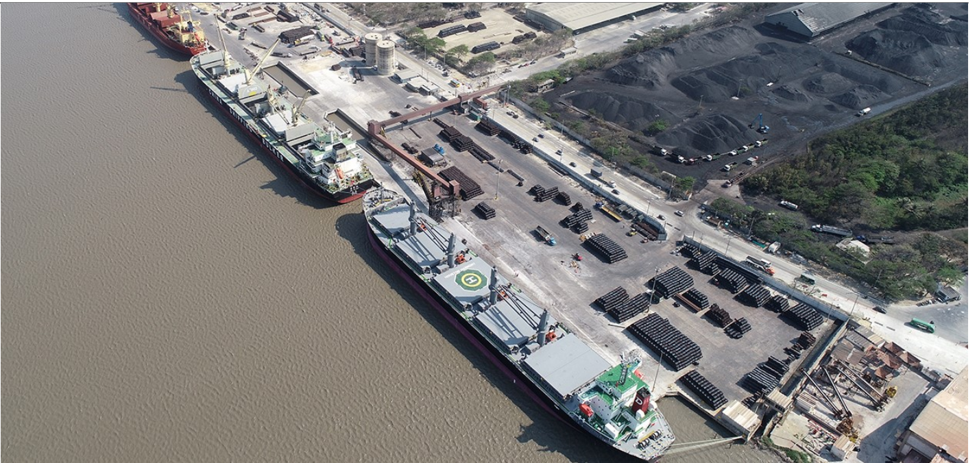
Sociedad Portuaria Compañía de Puertos Asociados COMPAS - Barranquilla