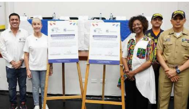
Gráfico 10. Cooperación entre Dimar y la Gobernación del Valle