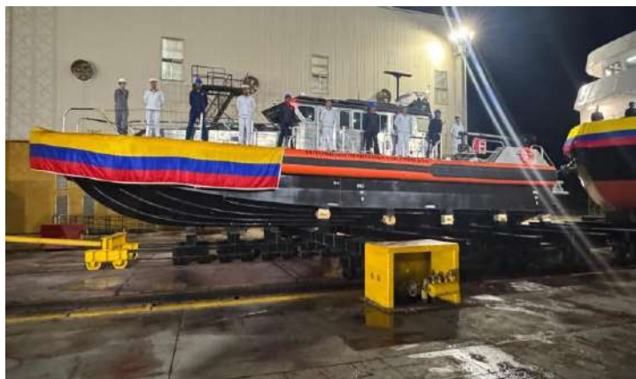
Gráfico 16. Nave insular ARC “Isla San Andrés”