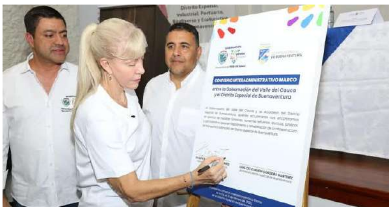
Gráfico 12. Cooperación entre Dimar y la Gobernación del Valle