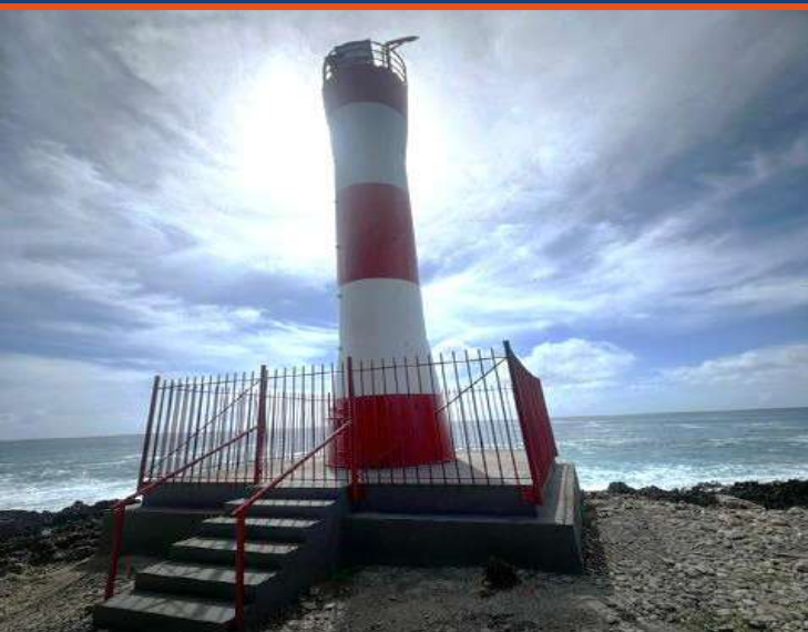
Gráfico 1. Faro Providencia

El Ministerio de defensa a través de la Dirección General Marítima contribuye a la seguridad y soberanía del territorio colombiano con la construcción y puesta en funcionamiento de faros en Providencia, Bahía Solano y San Andrés, mejorando la cobertura y efectividad de ayudas a la navegación en zonas de alta sensibilidad operativa, y apoyando el tráfico marítimo comercial y turístico.