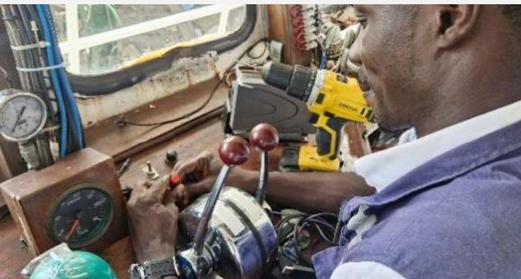
Gráfico 7. Instalación equipos satélites y botones de pánico

El Ministerio de Defensa – DIMAR en coordinación con la Gobernación del Valle del Cauca fortalecen la seguridad y el control de buques de cabotaje con la entrega de 85 equipos satelitales con botón de pánico, que permiten el monitoreo continuo durante sus recorridos por el litoral pacífico y en caso de emergencia emitir alertas en tiempo real, facilitando la respuesta inmediata. 30 enero 2025