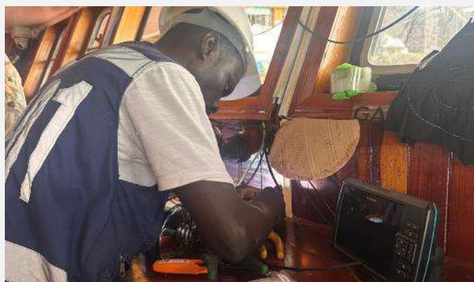
Gráfico 9. Instalación equipos satélites