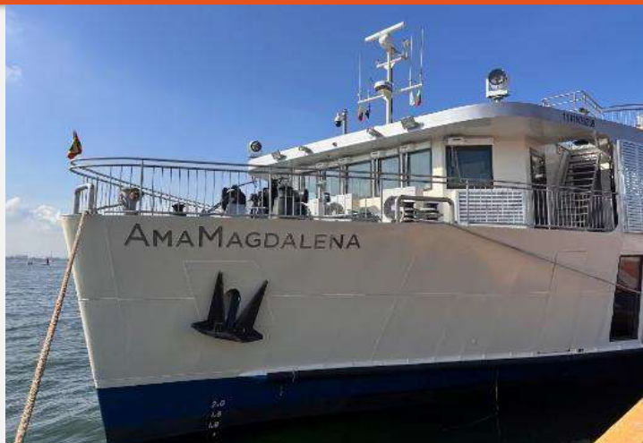
Gráfico 5. Crucero AmaMagdalena

Aportando al desarrollo económico y social de las regiones, desde las competencias de la Autoridad marítima se acompañó el inicio de operación del buque AmaMagdalena ( 6 de abril de 2025) y el arribo de cruceros turísticos internacionales al Golfo de Morrosquillo (31 de marzo de 2025) y Leticia (28 de abril de 2025) reactivando la economía local, fortaleciendo la conectividad marítima y posicionando nuevos destinos en rutas de cruceros.