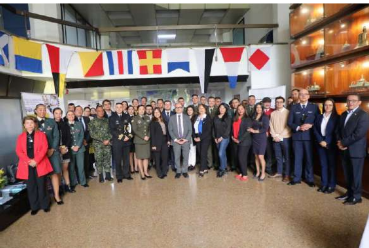
Gráfico 29. Asistentes evento BiblioDefensa 2025

La Dirección General Marítima (DIMAR), en cumplimiento de su compromiso con el fortalecimiento del conocimiento científico y marítimo del país, ha formalizado su ingreso al Sistema de Información de Bibliotecas de la Fuerza Pública (SiBFuP).