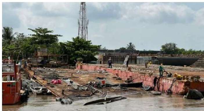
Gráfico 14. Proceso de reciclaje de embarcaciones en estado de abandono