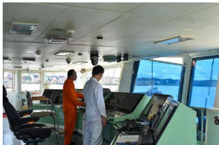
Gráfico 27. Seguimiento a la relimpia desde el puente de la embarcación.