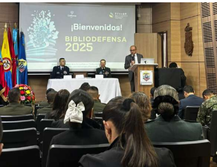
Gráfico 28. Apertura evento BiblioDefensa 2025