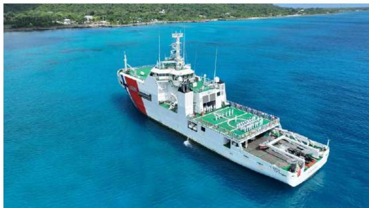
Gráfico 24. Buque ARC "Simón Bolívar" durante el levantamiento de 988 millas náuticas.

Durante 34 días, el buque ARC "Simón Bolívar" recorrió más de 3.000 millas náuticas en el Caribe colombiano, fortaleciendo la investigación marina y la seguridad marítima en la región insular, finalizando con éxito la misión de la campaña científica marina "7 Colores" en el Archipiélago de San Andrés, Providencia y Santa Catalina.