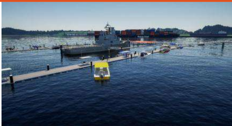
Gráfico 11. Entrega concesiones marítimas embarcadero turístico Buenaventura y Malecón

Aporte al desarrollo turístico de las regiones, el MDN-DIMAR hizo entrega de concesiones marítimas para la construcción del Embarcadero Turístico en Buenaventura y la construcción del malecón turístico de San Antero, proyectos que fortalecen la infraestructura turística, mejoran la conectividad marítima regional y dinamizan la economía local. Abril 2025