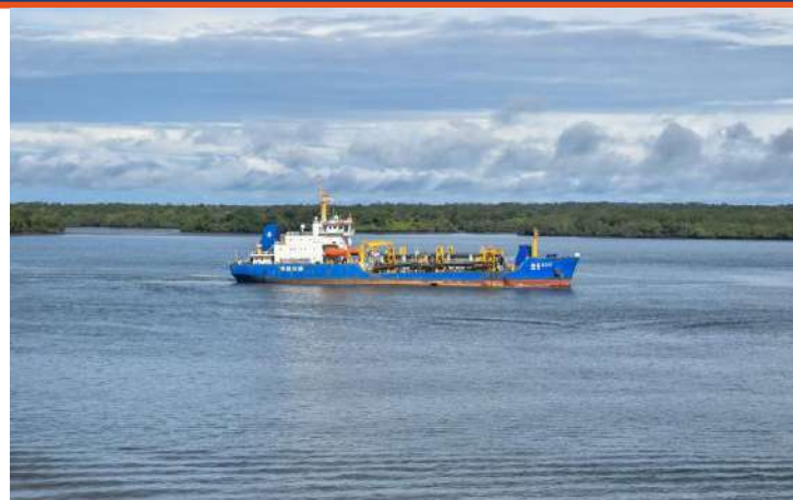
Gráfico 26. Jornada de dragado en la terminal de contenedores TCBUEN