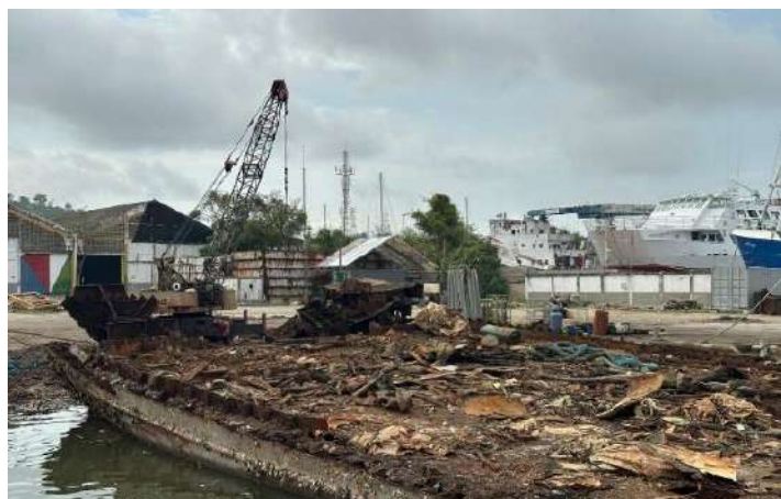
Gráfico 13. Embarcaciones en estado de abandono

El Ministerio de Defensa – DIMAR comprometidos con la Protección de Medio Marino y garantizando la seguridad en la navegación, lideró la verificación del proceso de reciclaje de embarcaciones en estado de abandono o que han cumplido su vida útil en la bahía de esta ciudad. En lo que va corrido del 2025, dos nuevas embarcaciones han completado el proceso de reciclaje y otras se encuentra en proceso de chatarrización.