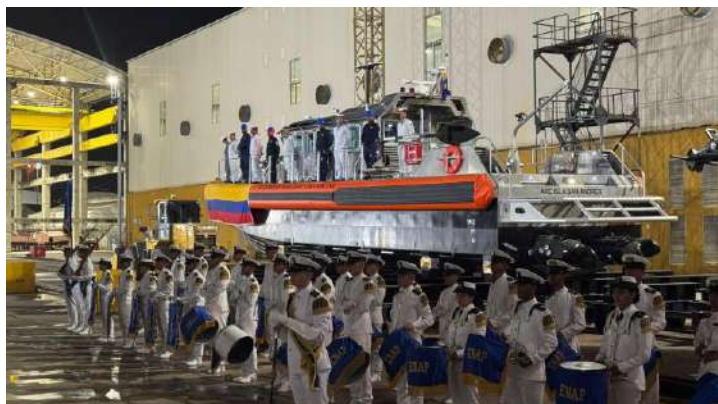
Gráfico 15. Presentación nave insular ARC “Isla San Andrés”

Su diseño tipo “insular” alcanza velocidades de hasta 25 nudos y capacidad para permanecer hasta cinco días en el mar, permite despliegue en misiones de búsqueda y rescate, control marítimo, protección ambiental, monitoreo de recursos naturales y salvaguarda de la vida humana en el mar.