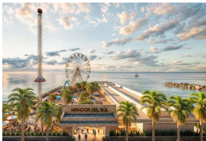
Gráfico 18. Mirador del sol