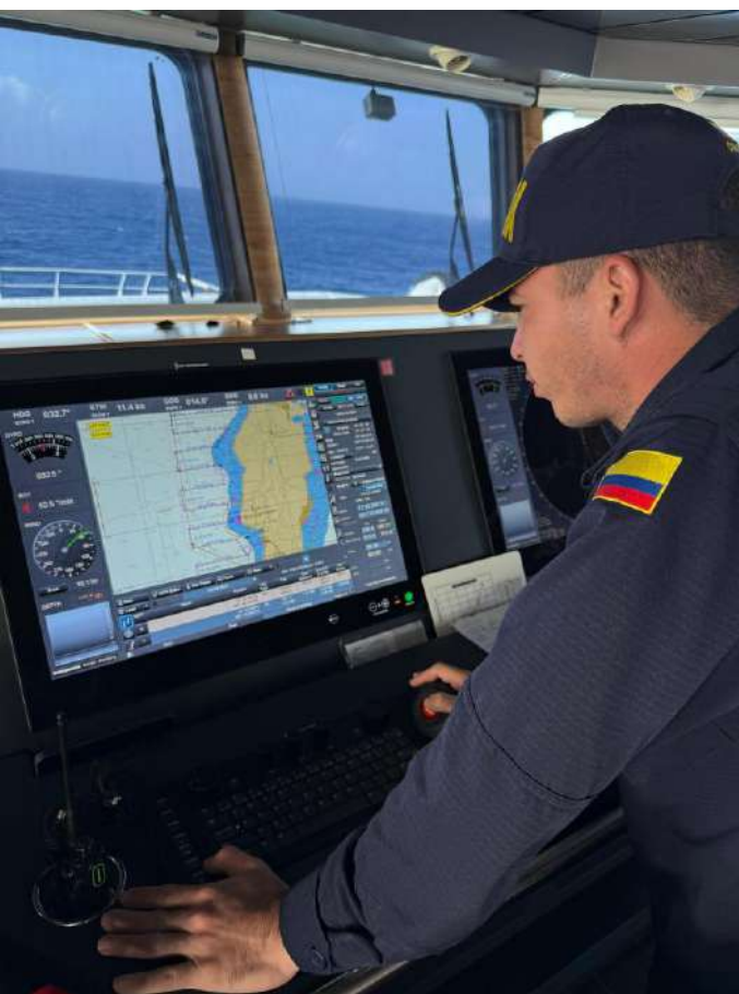
Gráfico 23. Revisión de cartas para el levantamiento de corrientes en las cuatro fases lunares

La operación benefició a más de 56.000 habitantes del territorio insular mediante intervenciones que incluyeron señalización marítima, levantamientos hidrográficos y recolección de datos científicos fundamentales para la seguridad durante la navegación.