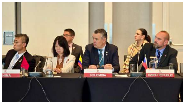
Gráfico 22. Representación Colombiana en el COMNAP