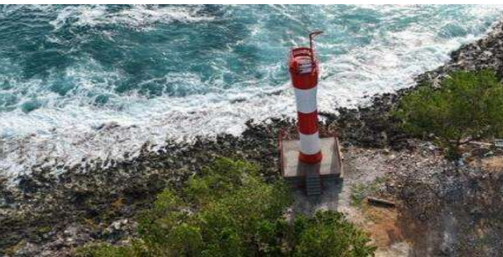
Gráfico 2. Faro Bahía Solano

El Ministerio de defensa a través de la Dirección General Marítima contribuye a la seguridad y soberanía del territorio colombiano con la construcción y puesta en funcionamiento de faros en Providencia, Bahía Solano y San Andrés, mejorando la cobertura y efectividad de ayudas a la navegación en zonas de alta sensibilidad operativa, y apoyando el tráfico marítimo comercial y turístico.