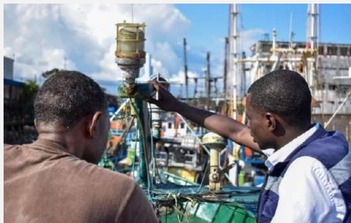
Gráfico 8. Instalación equipos satélites