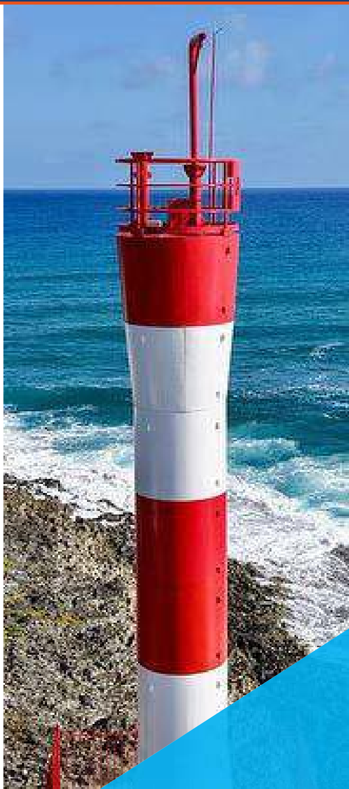
Gráfico 3. Faro hoyo soplador San Andrés