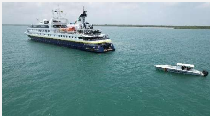
Gráfico 4. Arribo crucero internacional Golfo de Morrosquillo