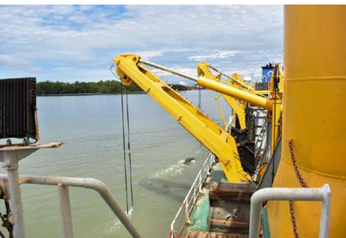
Gráfico 25. Dragado de mantenimiento - draga Hang Jun 4011

Se realizó dragado de mantenimiento en zonas portuarias de Buenaventura. Los trabajos, desarrollados con la draga Hang Jun 4011, durante las maniobras realizadas durante los meses de septiembre y octubre se retiraron 340.000 m 3 de sedimentos que caracterizan esta región acumulados en áreas de atraque y zonas de maniobra.