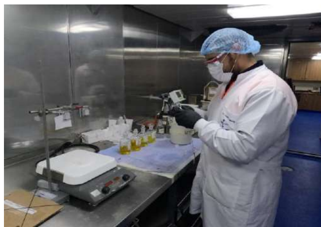
Gráfico 20. Procesamiento de muestras de oxígeno disuelto en agua de mar. ARC Simón Bolívar