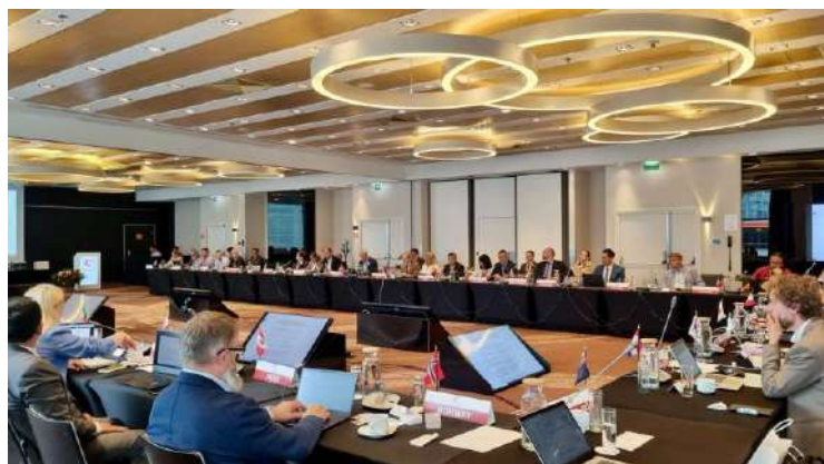
Gráfico 21. Sesión del COMNAP

Creado en 1988, el COMNAP es el principal foro de coordinación operativa entre programas antárticos nacionales, que promueve buenas prácticas para el desarrollo de actividades científicas y de apoyo logístico en el continente blanco.