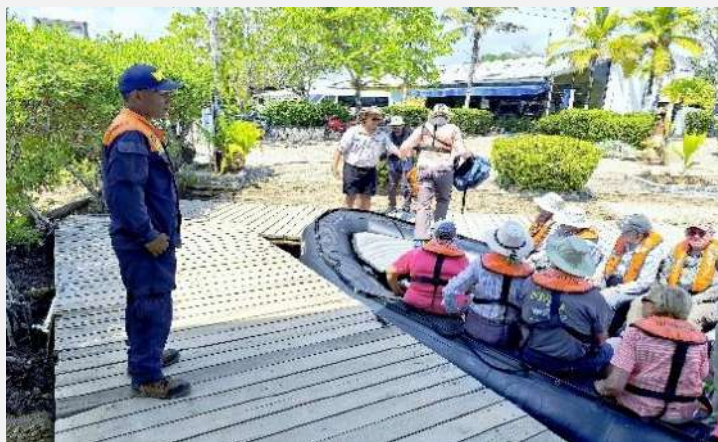
Gráfico 6. Arribo pasajeros cruceros internacionales