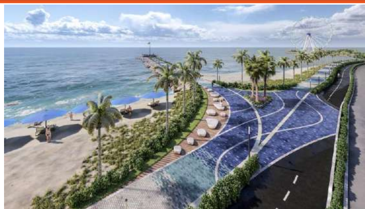
Gráfico 17. El Mirador del Espolón

Este proyecto, abarcará un área total de 129.344,25 m 2 , desde el sector de La Boquilla hasta el Centro Histórico, con el objetivo de consolidar a la ciudad como un referente internacional en turismo sostenible, a través de la recuperación de playas, la mitigación de la erosión costera, la generación de empleo y la creación de nuevos espacios públicos de calidad para residentes y visitantes.