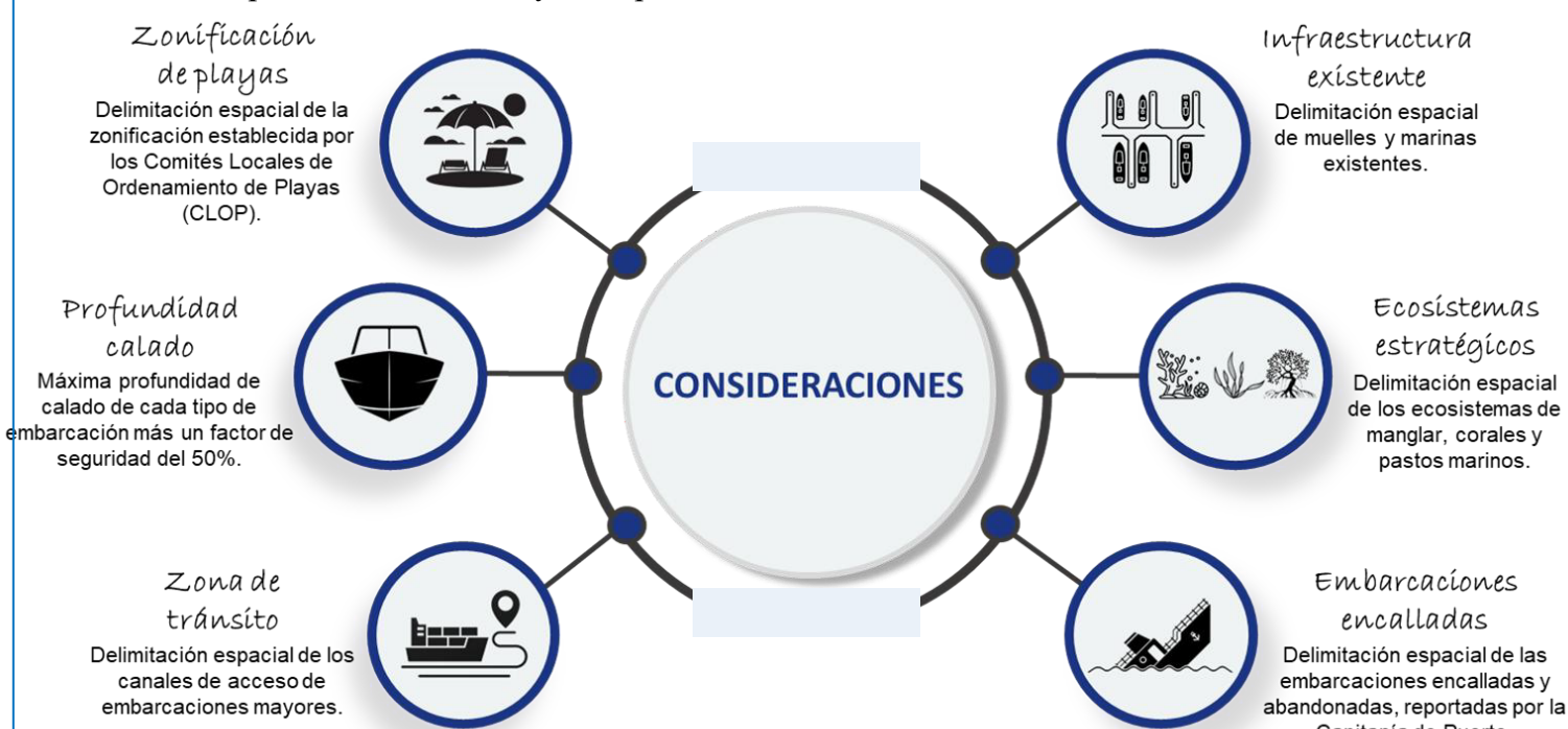
Figura 1. Consideraciones establecidas para la determinación de la CCERT

La DIMAR definió seis consideraciones para la determinación de la CCERT (Figura 1), teniendo en cuenta la información disponible en el CIOH y la Capitanía de Puerto de San Andrés: