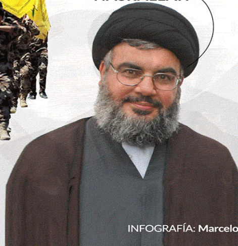
INFOGRAFÍA: Marcelo Regalado