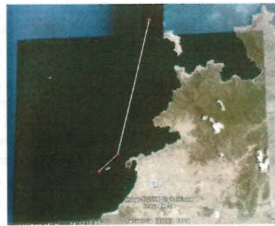
Recalada de la M/N ATLANTIC FORTUNE (fol. 133)

Las pruebas anteriormente transcritas, permiten descartar la hipótesis planteada por el Capitán y la tripulación de la nave ATLANTIC FORTUNE, referente a que el siniestro había tenido su origen en la largada del grillete ordenada por el Piloto Práctico, pues existen suficientes elementos de juicio para concluir que la causa precursora del siniestro tuvo lugar antes de que la nave fuera abordada por el Piloto Práctico y como consecuencia de la aproximación imprudente que realizó el Capitán de la nave ATLANTIC FORTUNE.