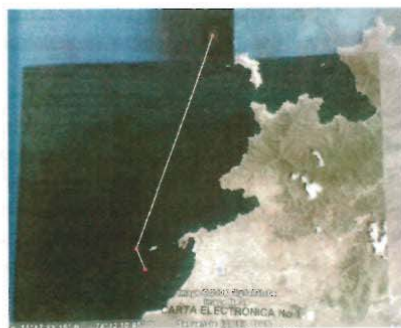
Recalada convencional (fol. 132)