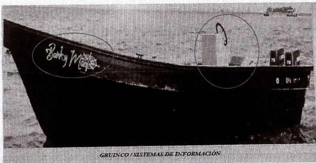
GRUINCO / SISTEMAS DE INFORMACIÓN