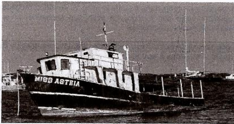
Imagen de la motonave Miss Astria en la Bahía Interna de San Andrés

Por otro lado, es importante mencionar que el 10 de noviembre de 2000 el Archipiélago de San Andrés Providencia y Santa Catalina fue declarado Reserva de Biosfera por el Program of Man and the Biosphere (MAB) de UNESCO, denominada con el nombre de SEAFLOWER, la cual cuenta con Plan de gestión para dicha estrategia complementaria de conservación.