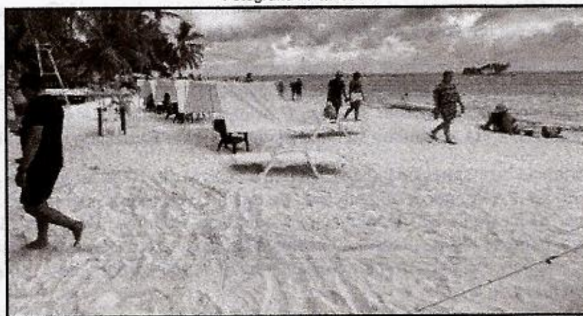
Fotografía 2. Carpas